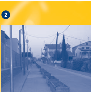
butlletí quinzenal d'informació municipal de l'Ajuntament de Lliçà d'Amunt / 15 de febrer de 2005